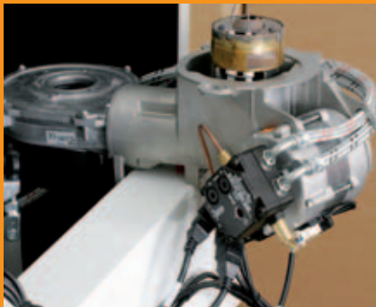
Verbrennungseinheit in Wartungsposition einhängen