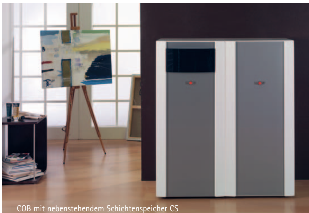
COB mit nebenstehendem Schichtenspeicher CS