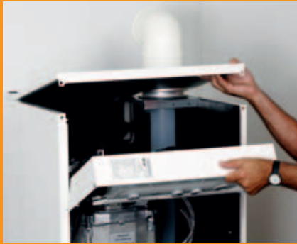
Verkleidung öffnen und den Regelungskasten herunterklappen