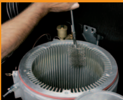
Wärmetauscher mit Bürste reinigen