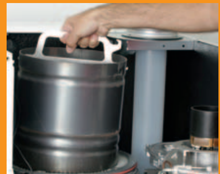
Brennkammer und Verdränger mit Wartungswerkzeug herausziehen