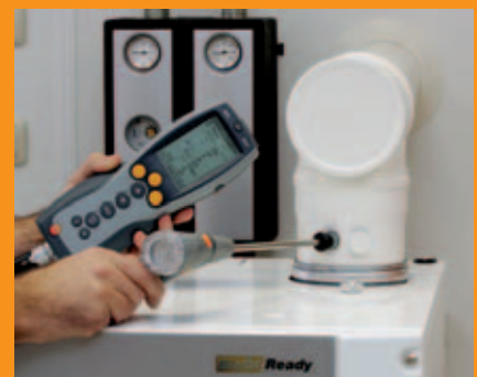
Verkleidung montieren und Verbrennungswerte kontrollieren