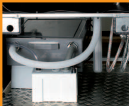
Siphon, Neutralisation und Kondensatpumpe reinigen