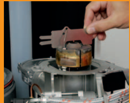
Kontrolle der Zündelektroden